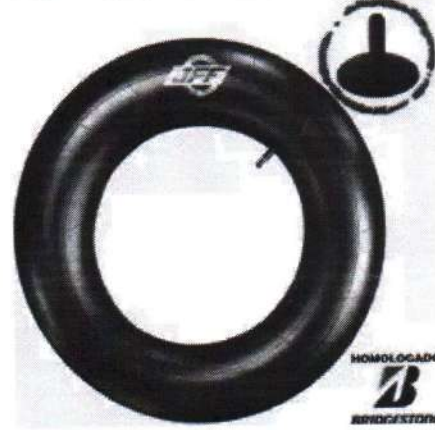
Camara De Ar Fr 13/14 Tr13 Veiculos Leves Aro 13/14